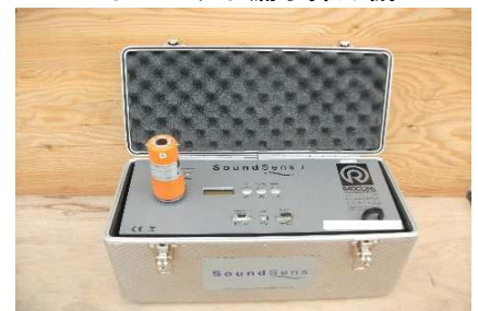
多点ログ相関式漏水探知機