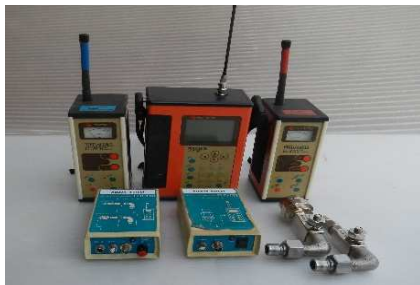
相関式漏水探知機