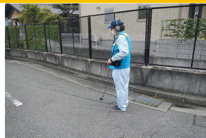
路面音聴調査(漏水探知機)