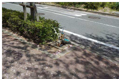
相関式漏水探知機調査