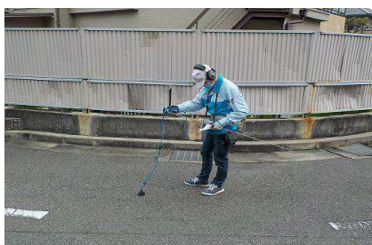
路面音聴調査(漏水探知機)