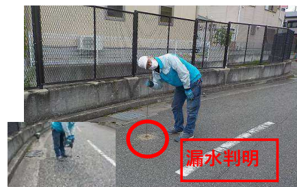
路面ポーリング 地中噴射音確認