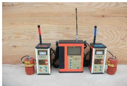
相関式漏水探知機