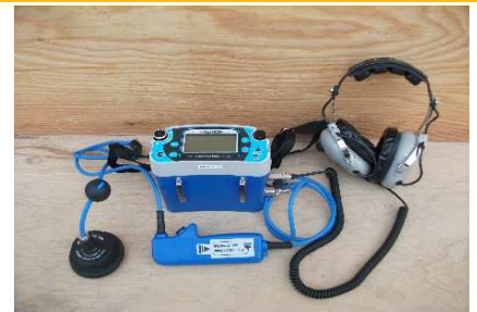
ノイズカット漏水探知機